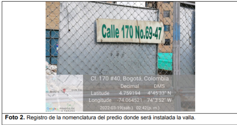
Foto 2. Registro de la nomenclatura del predio donde será instalada la valla.